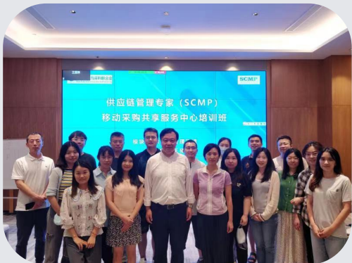
(移动采购共享服务中心SCMP培训班)

已为包括中国移动、中国电信、中国联通、中国铁塔、国家电网、南方电网、中国华能、中国通用、华润集团、中国中车、东航集团、南航集团、中国船舶、兵器集团、中核集团、航天科技、中国中化、中远海运、招商局、山东港口等众多企业员工提供项目培训，且反响良好。