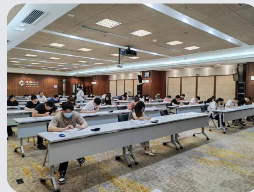
(通用集团SCMP内训班考试现场)