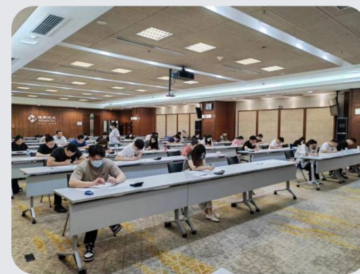
(通用集团SCMP内训班考试现场)