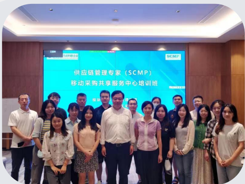
(移动采购共享服务中心SCMP培训班)

已为包括中国移动、国家电网、兵器集团、中国电信、中国通用、华能、南方电网、厦门建发、厦门国贸、厦门象屿、德国博世集团、广汽新能源汽车有限公司等在内的众多企业员工提供SCMP认证项目培训，且反响良好。